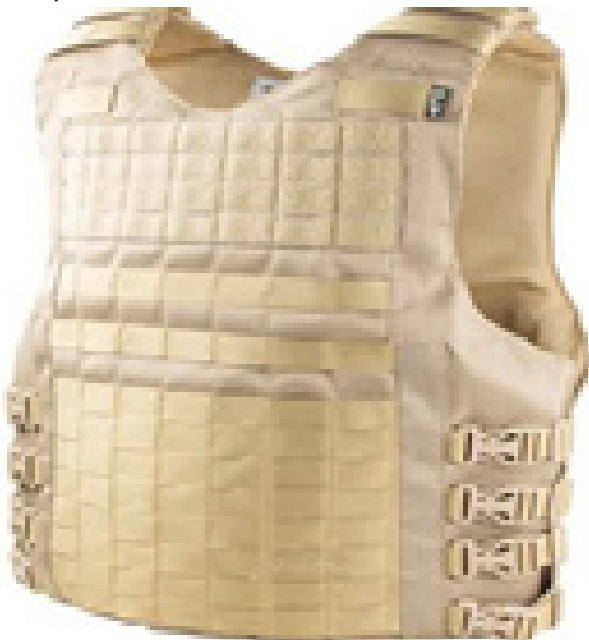
ITEM 07: Capa de Colete